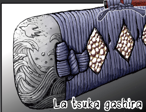
La tsuka gashira